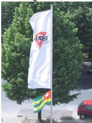
CVJM- und Togo-Fahne